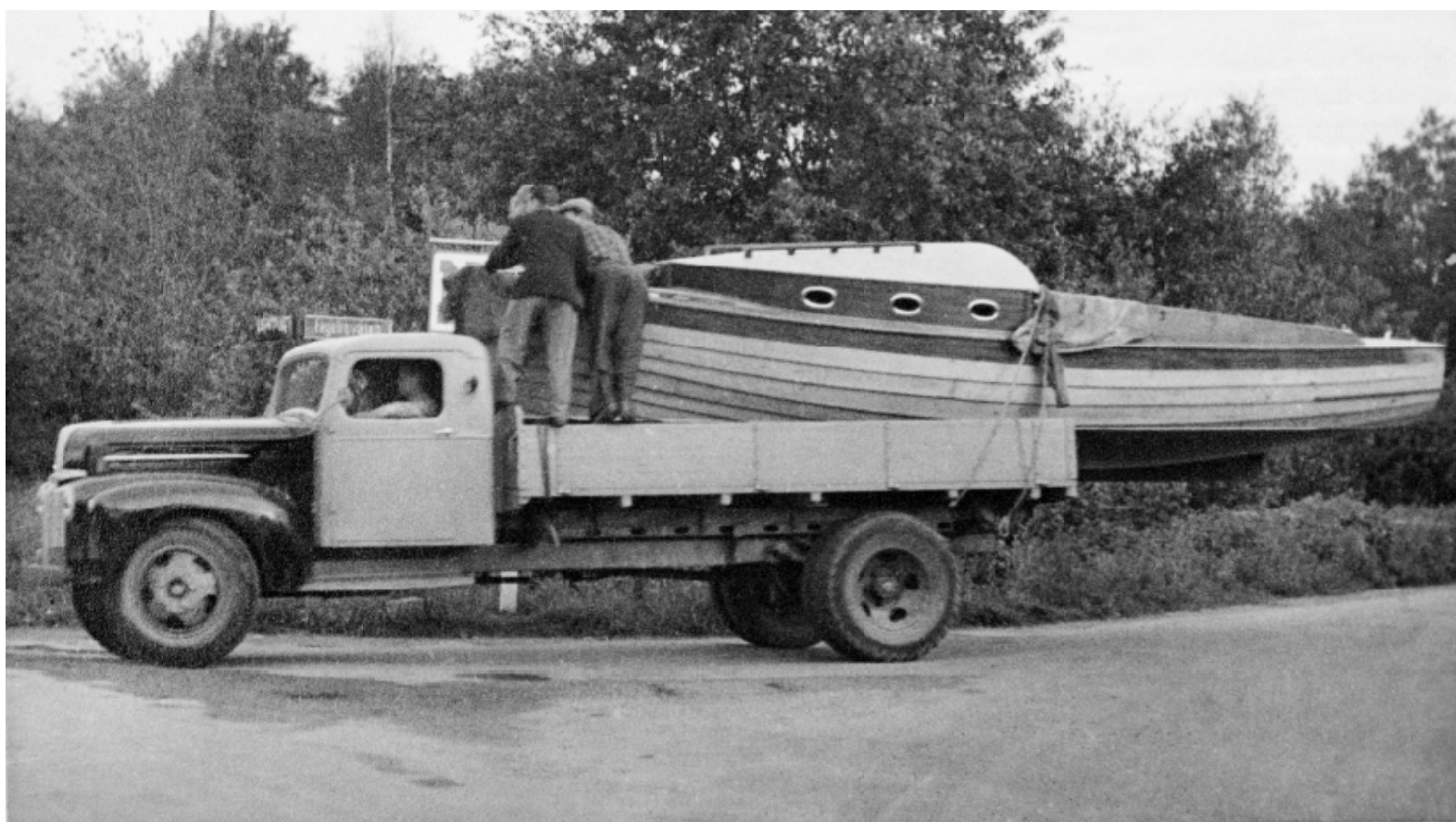
En tidig båttransport. Bilden är från vårt historiska arkiv. Hur det gick för båten? Ingen aning, men vi finns kvar, större än någonsin.