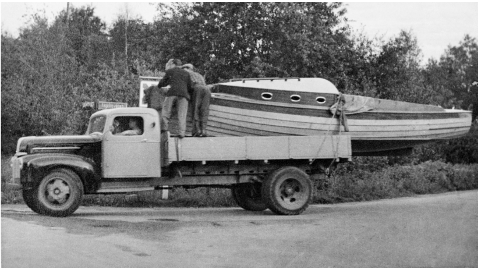
En tidig båttransport. Bilden är från vårt historiska arkiv. Hur det gick för båten? Ingen aning, men vi finns kvar, större än någonsin.